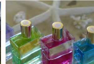
ミニ・クリスタルショップもあります 各種ヒーリングセッションも