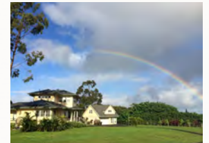
ナディア村は最高のレインボウビューポイントです 虹の島ならではの風景