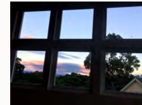
刻々と変化する空の色 風の香りとともにゆっくりお過ごしください

暮らすようなマウイを楽しみたい。自由に観光してまわりたい。自然のなかでゆったり過ごしたい。という方には、ステイのみの滞在をお勧めします。ファミリーでもグループでも、お一人様も歓迎です。キッチン、バスタイレ付きのプライベートなコテージ（ベッド5台）一棟貸切もしくはシェアも選べます。（1泊：75ドルから～長期滞在割引あり）