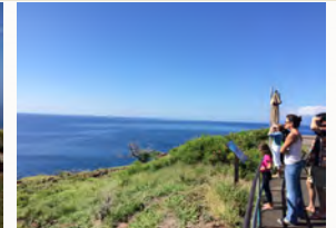
12月～3月は 野生のクジラたちがこの島のまわりに集まってきます