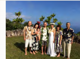
ハワイ古典式ウエディングやベイビーブレッシングセレモニーなども

公共の乗り物がほとんどないマウイでは移動は不便ですし不安もあります。効率よく観光したい、通常のオプションツアーなどではいけないようなところも案内してほしい・・・という方にはこちらがおすすめです。マウイのお勧めのヒーリングスポットや秘境、聖地などへご希望にあわせてお連れいたします。ロミロミマッサージや各種セッション、ハレアカラ、ドルフィンや鯨のウォッチングクルーズ、ウエディング、乗馬などのアクティビティの手配もいたします。